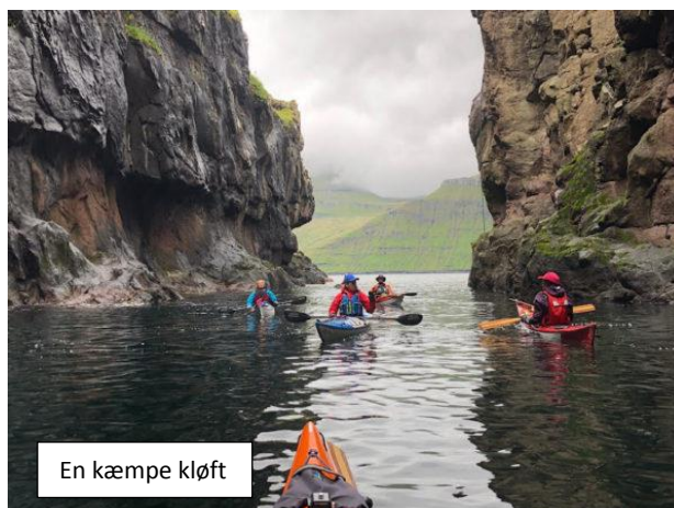
En kæmpe kløft