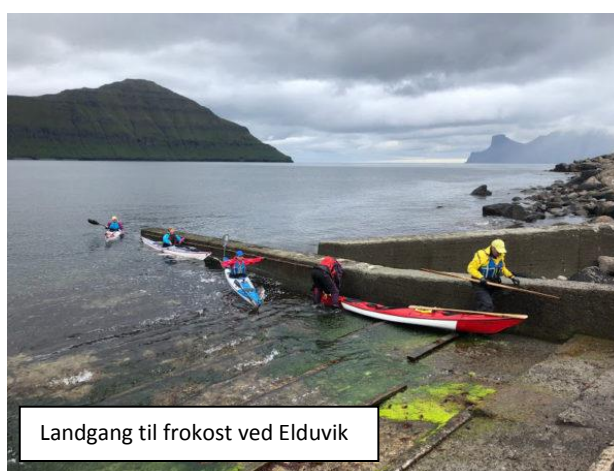
Landgang til frokost ved Elduvik