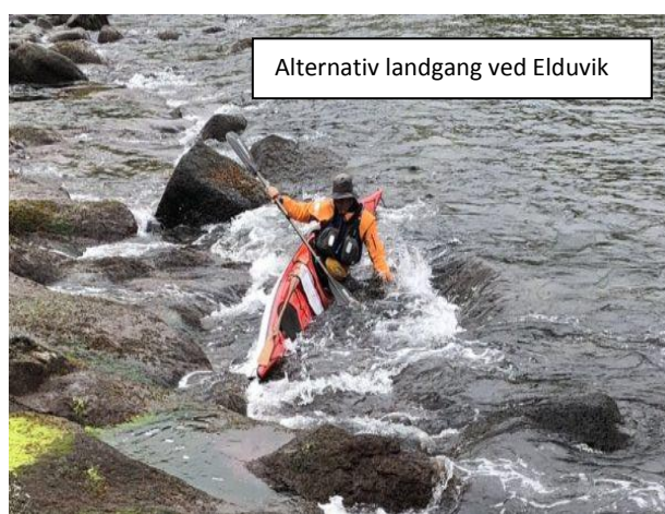
Alternativ landgang ved Elduvik